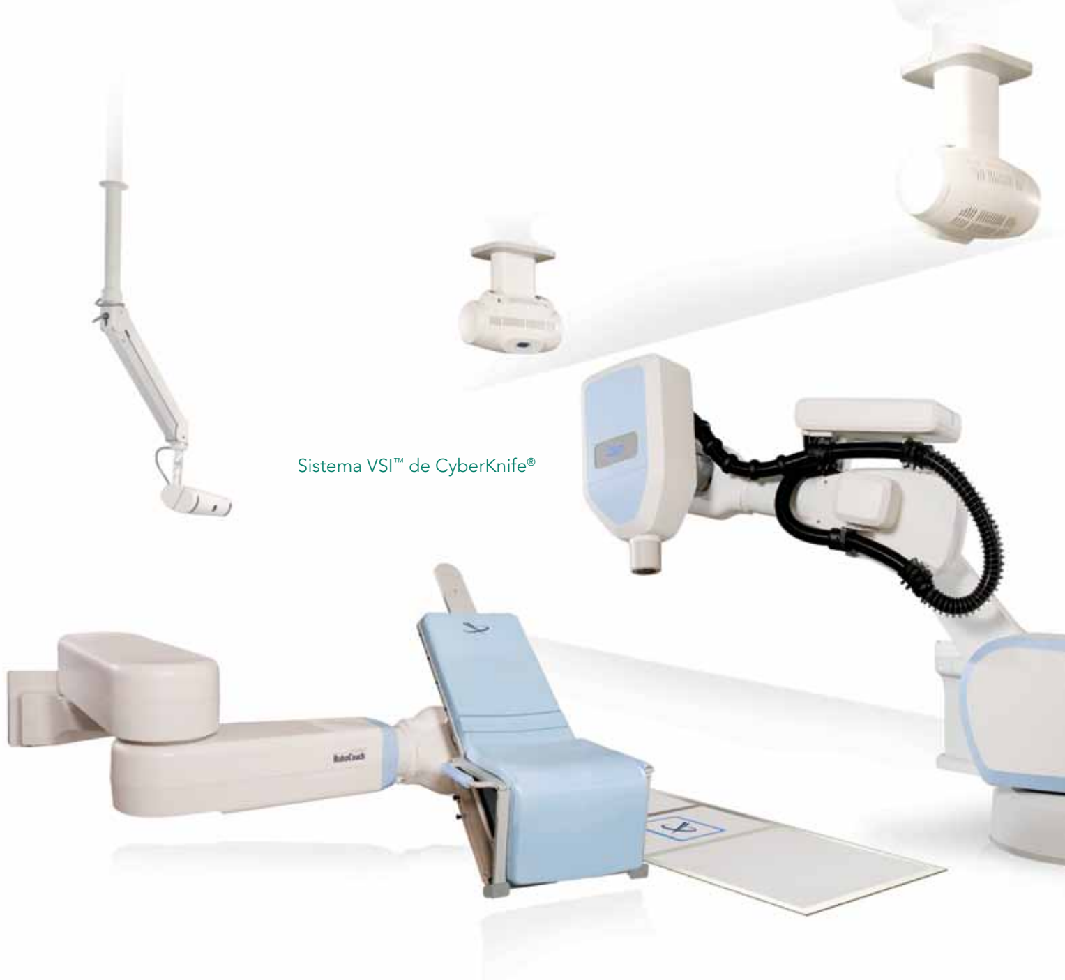
Sistema VSI™ de CyberKnife®